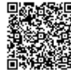
verwantschapstabel educatieve minor